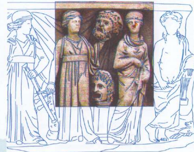
Creazione del modello del manufatto per mezzo di fotomosaico

La visita al cantiere di restauro del sarcofago delle Muse offre, la possibilità di conoscere gli imperativi del percorso che caratterizza la conservazione e di portare alla conoscenza del grande pubblico alcune fasi dell'attento lavoro che accompagna la Tutela e la valorizzazione delle opere d'arte.