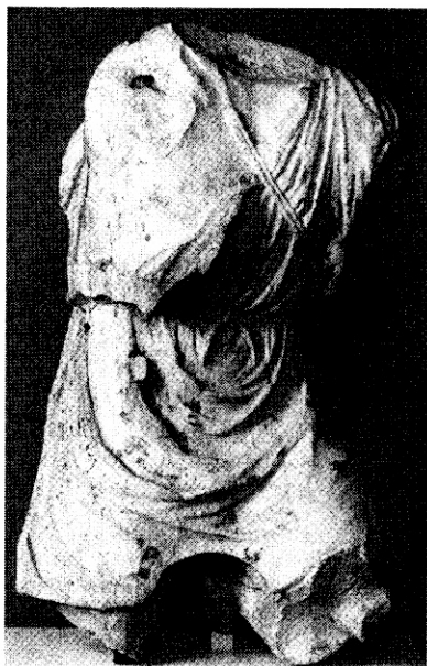
Fig. 6 - Torso di Mitra tauroctono della Collezione Giustiniani